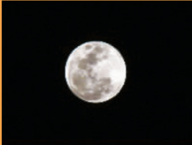
23:50,月儿又越来越亮了