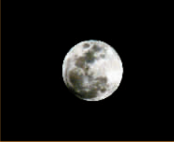
22:30,接近食甚,月儿更暗了