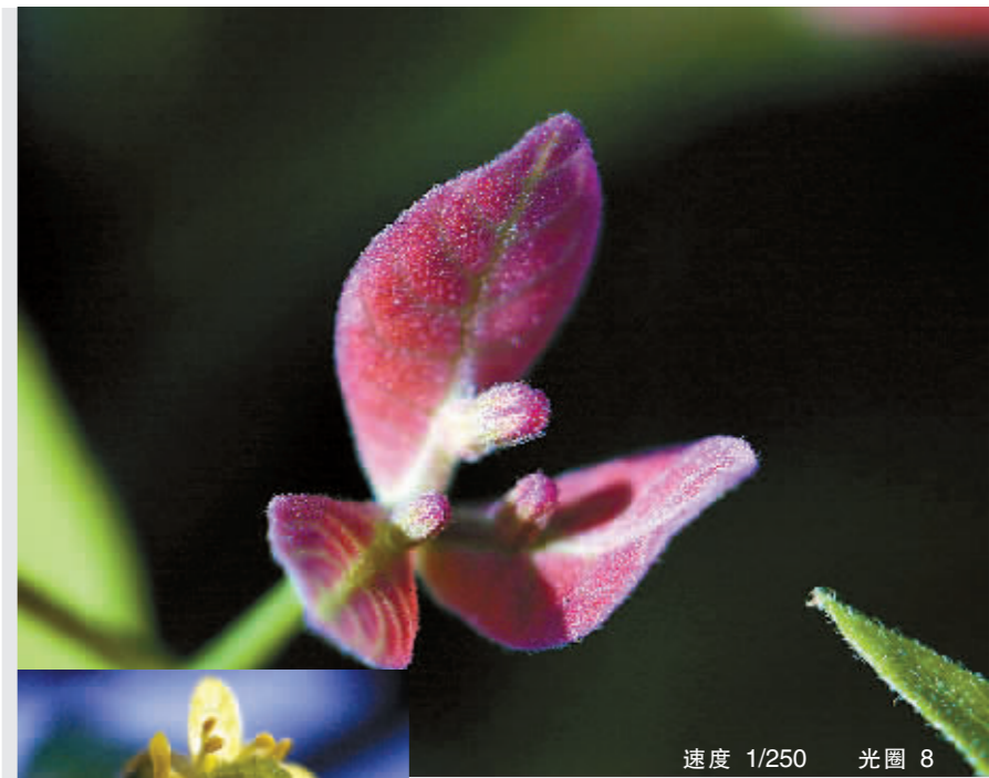
速度 1/250 光圈 8