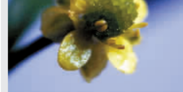
速度 1/6 光圈 11