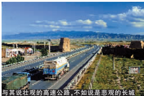
与其说壮观的高速公路,不如说是悲观的长城