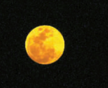
18:40,初升的月亮恰似橘红的圆盘