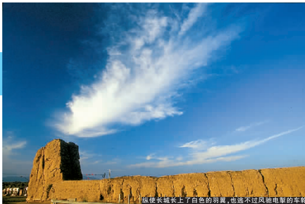
纵使长城长上了白色的羽翼,也逃不过风驰电掣的车轮