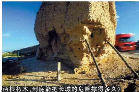
两根朽木,到底能把长城的危险撑得多久?