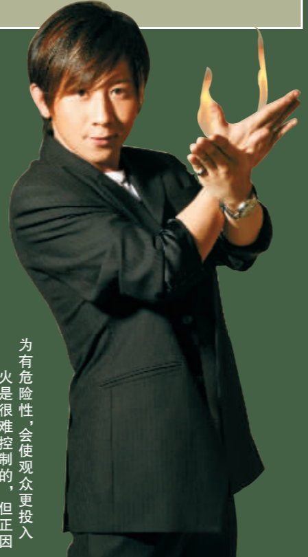
为有危险性，会使观众更投入，火是很难控制的，但正因